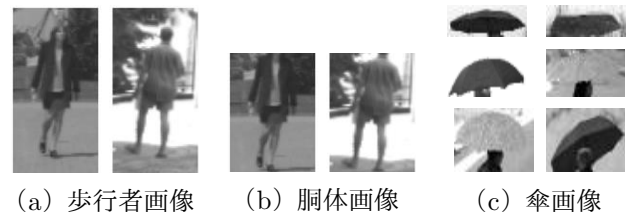
図 2 学習用画像例