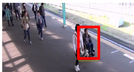
Fig2. Example of detection results

る Faster R-CNN と検出精度を比較した。学習用画像には、車椅子利用者の画像 1,993 枚と、Pascal VOC 2007 (3) に含まれる歩行者の画像 1,025 枚を使用した。評価用映像として、車椅子利用者や歩行者を含む映像 23 本を使用した。評価指標として、Free-response Receiver Operating Characteristic (FROC) 曲線を用いた。FROC 曲線は、車椅子利用者の検出結果のしきい値を変化させることで描画した。実験結果を図 1 に、検出結果の一例を図 2 に示す。検出対象に歩行者を加えることで、各 False Positive Per Image (FPP1) において Recall が向上することを確認した。